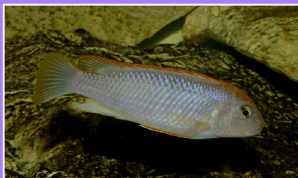
Eau douce Cichlidae Malawi