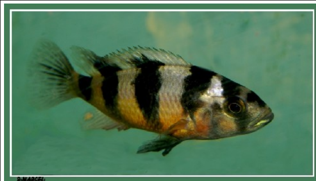
Eau douce Cichlidae Victoria