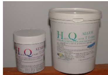
Stand nourriture HQ