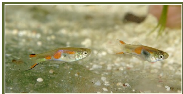
P. sp. endlers