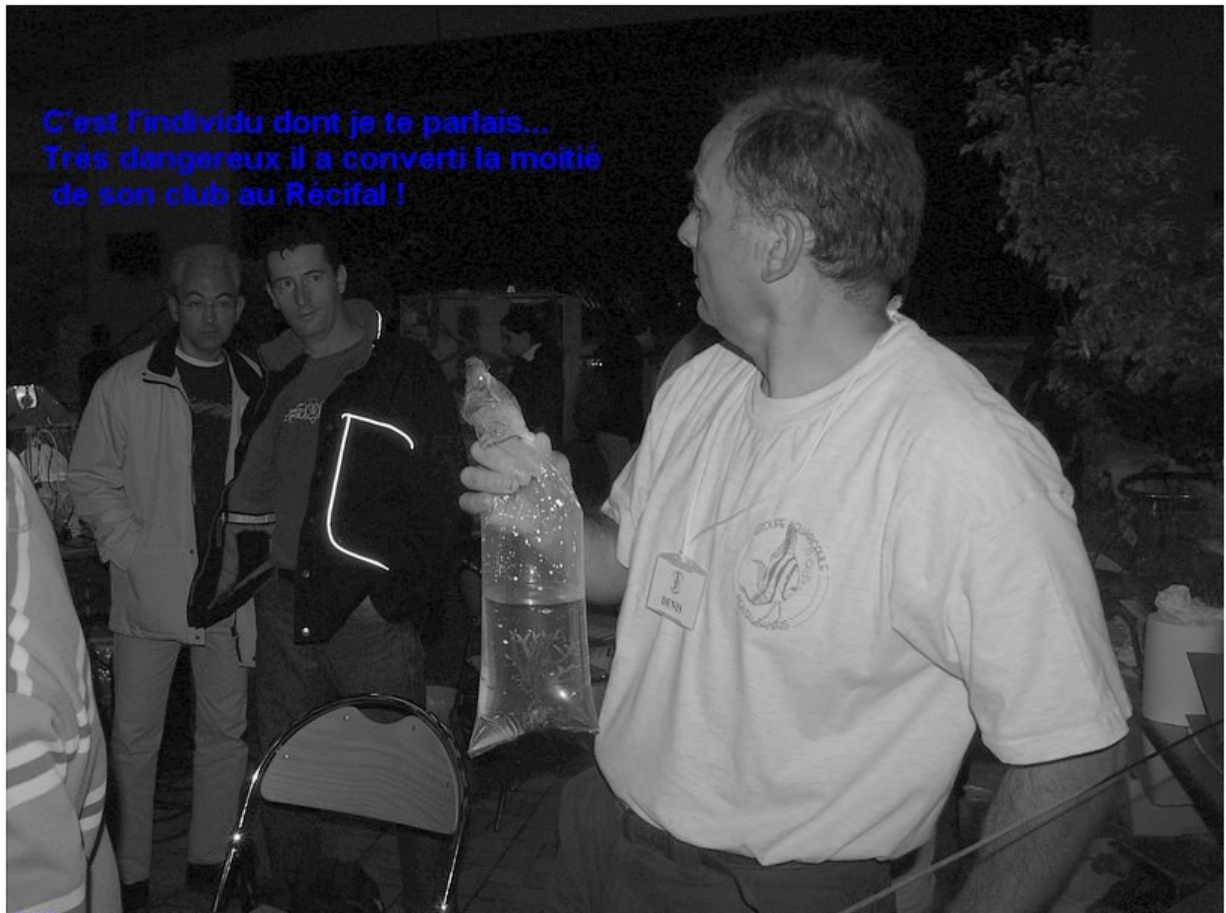
En conclusion belle manifestation bravo à toute l'équipe du GAM, R MARCEL