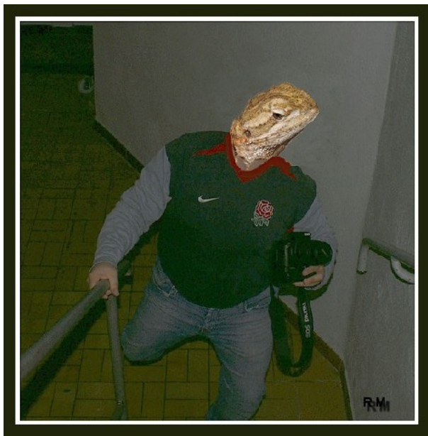
Le soir j'ai eu des hallucinations