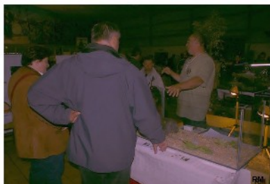
Les tortues terrestres